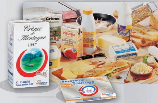
Crèmerie - Beurre - Œufs - Fromages