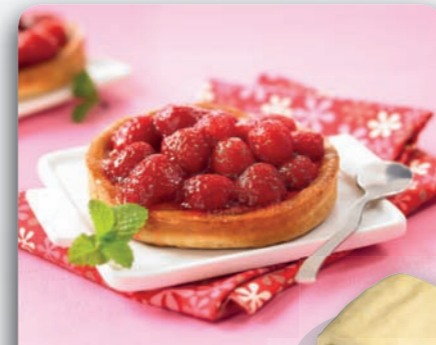
Surgelés boulangerie pâtisserie