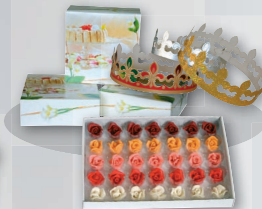
Emballages - Décorations