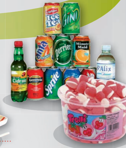
Confiseries - Boissons