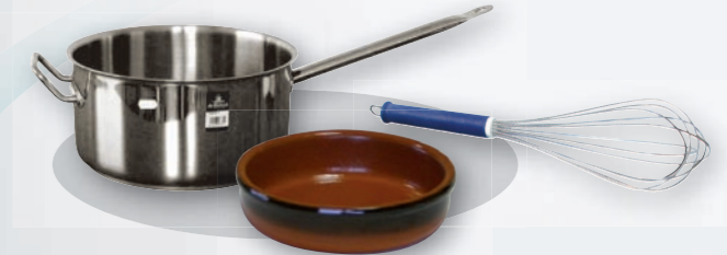
Vaisselle - Consommables