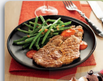
Surgelés restauration - Glaces