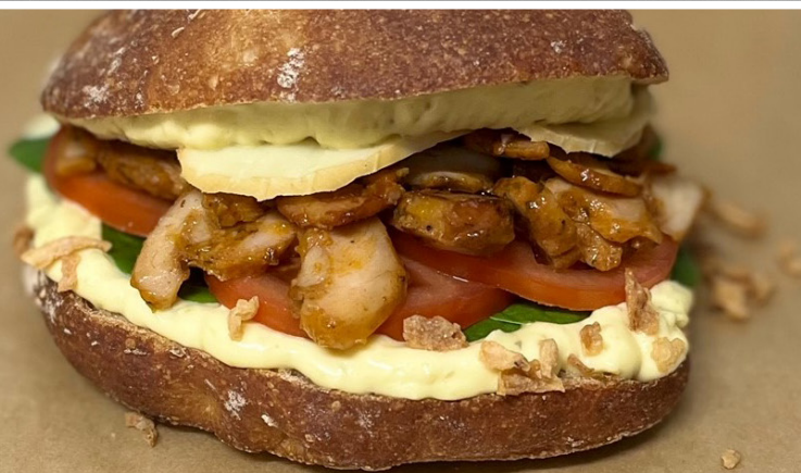
Suggestion de présentation