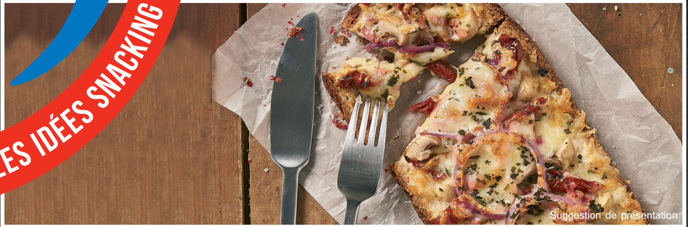
Suggestion de présentation