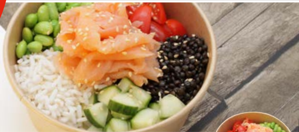
Suggestion de présentation